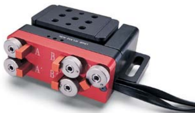
図はModel 8081電動5軸チルトアライナ