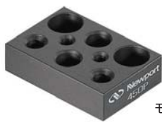
モデル450Pアダプタプレート

1ステージのフレームを直接他のプラットフォームに取り付けることによって多軸移動システムを組み立てることができます。アダプタプレート450Pには、ポストホルダーおよび他の機器を取付け、光学テーブルやブレッドボードに固定するための一群のタップおよび取付用通し穴が備わっています。