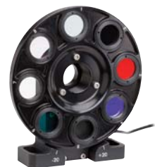
電動フィルタホイール

モデル5214および5215フィルタホイールにはNDフィルター式が付属しています。