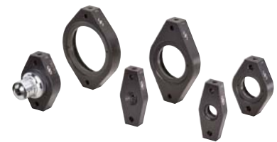
RMSねじマウント (opto-mechanicsカタログ参照)