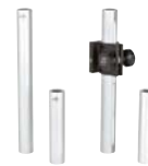
標準およびheavy duty ロッド (P480参照)