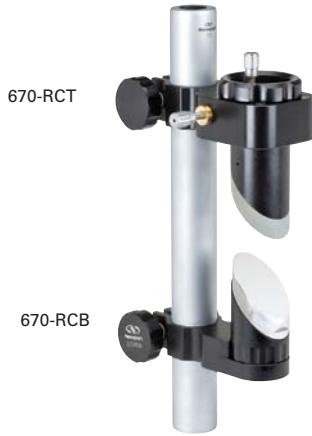
モデル70ロッドにマウントし、Newportの精密オプティクスを実装した状態