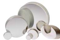
広帯域金属コーティングミラー (P23参照)