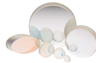
Borofloat 33広帯域誘電体ミラー (P25参照)