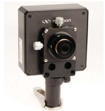
平行レンズアセンブリとマウント