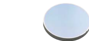
ゲルマニウムウインドウ (P180を参照)