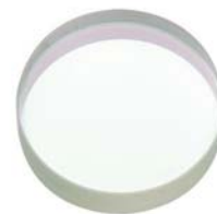
超広帯域誘電体ミラー (P18を参照)