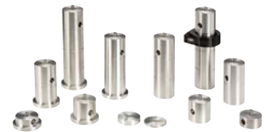
PSシリーズ ペディスタルポストシステム (P466参照)