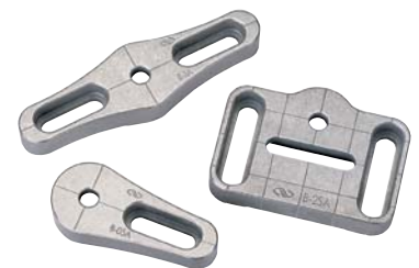
スロット付きベース (P422参照)