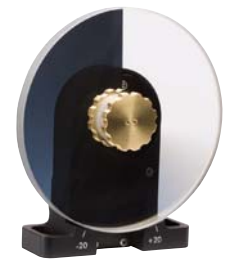
円形可変NDフィルタ用オプションを付けた New Step™ NSR電動回転ステージ