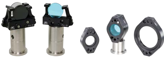
FH-1Sフィルタホルダ (P503参照)