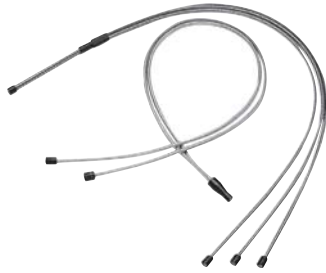
77536 3分岐ファイババンドルおよび77533 2分岐ファイババンドル

この多分岐ファイババンドルは、1つの共通端部と、2つまたは3つの分岐で構成されています。低価格でシンプルなビームスプリッターまたはビームコンバイナとしてご利用いただけます。端部はすべてOriel標準11 mmフェールールで終端されています。