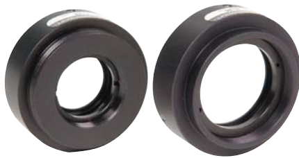
フランジマウントセル