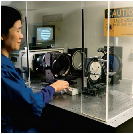
光学表面の形状誤差は、光学干渉計を使用して検査します。