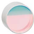
ウルトラショートパルス用高反射ポンプミラー (P9参照)