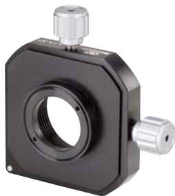
LA1V-XYレンズポジショナ (P324参照)