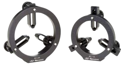
ACシリーズ アジャスト式レンズチャック (P317参照)