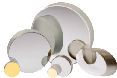
広帯域金属コーティングミラー (P23 ~参照)