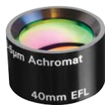
赤外アクロマティックレンズ (P155参照)