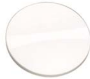
赤外線レンズ (P75参照)